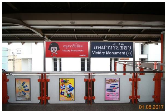
รูปที่ 3.3 ตัวอย่างผลงาน ของบริษัท วี จี ไอ โกลบอล มีเดีย จำกัด (มหาชน)