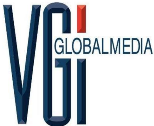
รูปที่ 3.1 โลโก้บริษัท วี จี ไอ โกลบอล มีเดีย จำกัด (มหาชน)