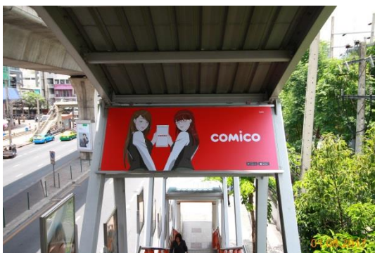
ตำแหน่ง Overhad boa