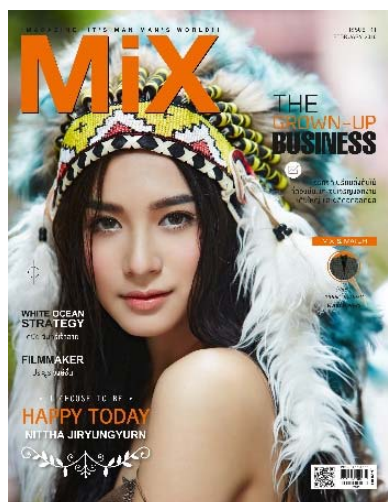
รูปที่ 3.4 ตัวอย่าง MIX MAGAZINE