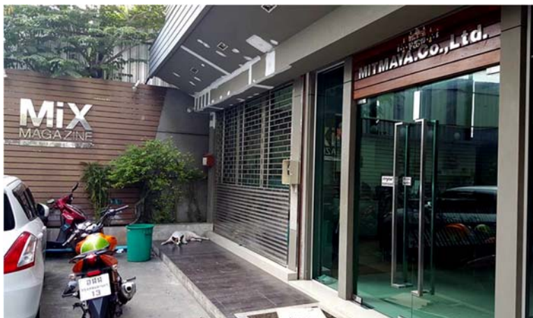
รูปที่ 3.3 บริษัทที่ปฏิบัติงานสหกิจศึกษา บริษัท มิตรมาया จำกัด