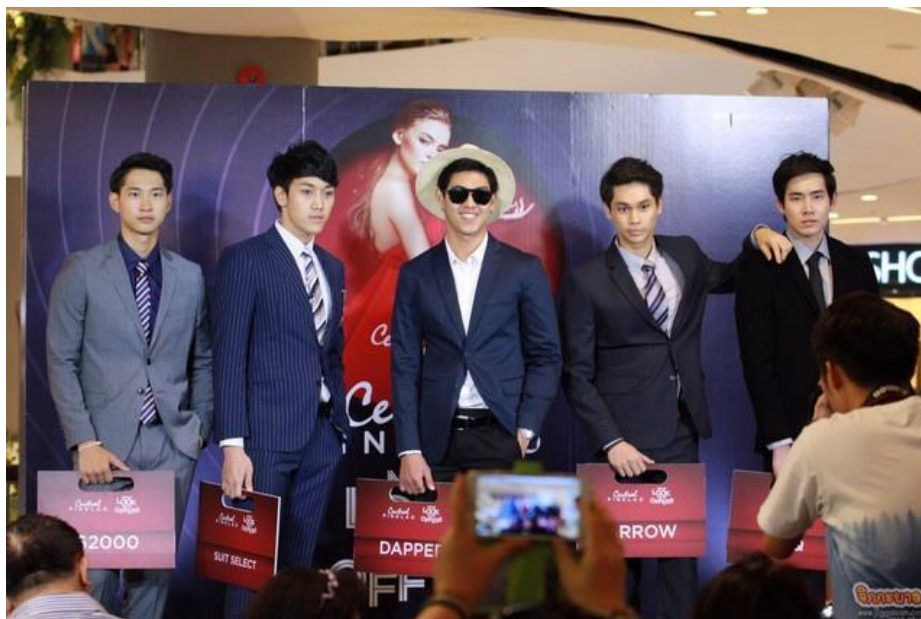
รูปที่ 4.7 ภาพบรรยากาศการเดินแบบแฟชั่น