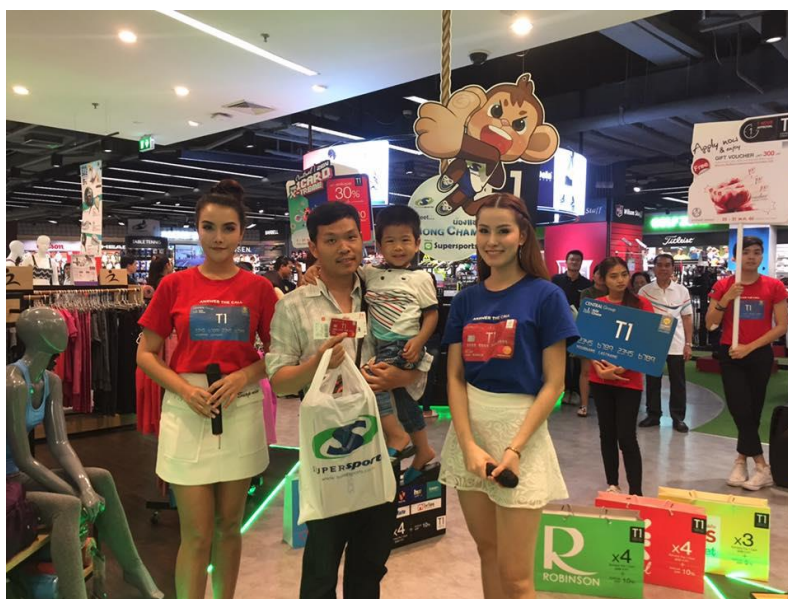
รูปที่ 4.4 ภาพบรรยากาศการเดินประชาสัมพันธ์ไปยังซูเปอร์สปอร์ตและเชิญชวนลูกค้าเข้าเล่นเกมร่วมกิจกรรม

4.3.4 เดินประชาสัมพันธ์กิจกรรมไปยังบริเวณซูเปอร์สปอร์ตชั้น 4 และบริเวณพาวเวอร์บาย ชั้นจี วันละ 2 รอบ โดยรอบแรกจะเดินในเวลา 12:00-13:00 น. และรอบที่ 2 จะเดินในเวลา 17:00-18:00น. เพื่อเป็นการประชาสัมพันธ์บัตรเซ็นทรัลเดอะวันและสิทธิพิเศษต่างๆ และมีการเล่นเกมสัปดาห์เปิดแผ่นป้ายและการนำใบเสร็จที่ซื้อสินค้าผ่านบัตรเซ็นทรัลเดอะวันนำมาแลกกิฟวอยเซอร์เพื่อเป็นส่วนลดในการซื้อสินค้าครั้งต่อไป และมีการแจกของรางวัลต่างๆมากมาย