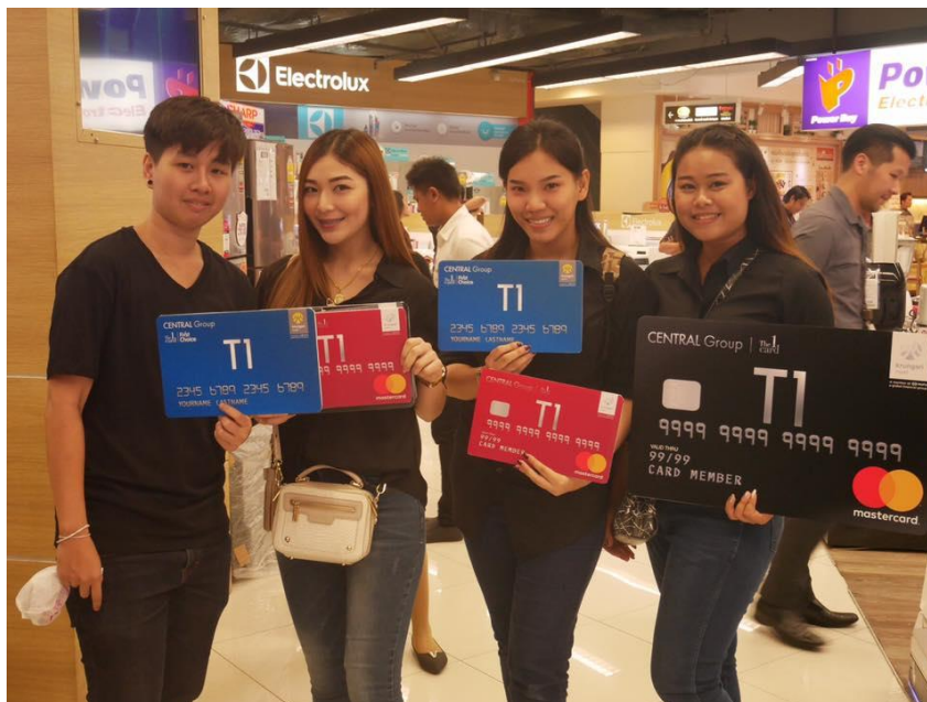
รูปที่ 4.5 ภาพขณะเดินประชาสัมพันธ์ไปยังพาวเวอร์บายชั้นจี

4.3.5 ถ่ายภาพบรรยากาศในกิจกรรมต่างๆ เช่น มินิคอนเสิร์ตจากศิลปินชื่อดัง อาทิ กษา เอ เอฟ , เจมส์มาร์ , เกรท วรินทร์และเอ๊ะ จิรากร ร่วมร้องเพลงและแจกของรางวัลให้กับแฟนคลับ และกิจกรรมการเล่นเกมนบนเวที เป็นการให้ลูกที่ซื้อผ่านบัตรเครดิตเซ็นทรัลเดอะวันได้ร่วมเล่นเกมซื้อตามจำนวนที่ซื้อสินค้า และเกมเปิดแผ่นป้ายจับคู่สิบบัตรเครดิตให้ตรงกัน การเดินแบบแฟชั่น การสาธิตการทำสปาเก๋ตตี้จากเซฟของผลิตภัณฑ์ซูเปอร์สเปนเซอร์ เป็นต้น