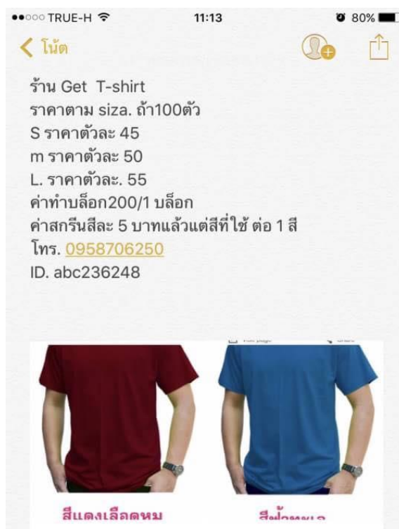
รูปที่ 4.3 ติดต่อสอบถามราคาเสื้อยืดพร้อมสกรีนลายบัตรเครดิต ร้านเก็ต ทีเชิ้ต