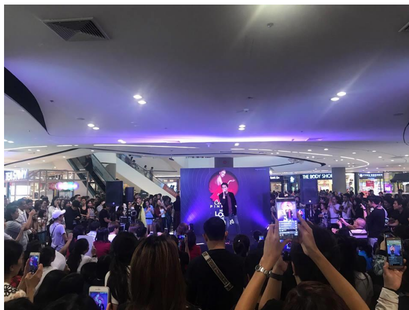
รูปที่ 4.6 บรรยากาศกิจกรรมมินิคอนเสิร์ตบนเวทีภายในงานนิวลูกนิวออฟเฟอร์

4.3.5 ถ่ายภาพบรรยากาศในกิจกรรมต่างๆ เช่น มินิคอนเสิร์ตจากศิลปินชื่อดัง อาทิ กษา เอ เอฟ , เจมส์มาร์ , เกรท วรินทร์และเอ๊ะ จิรากร ร่วมร้องเพลงและแจกของรางวัลให้กับแฟนคลับ และกิจกรรมการเล่นเกมนบนเวที เป็นการให้ลูกที่ซื้อผ่านบัตรเครดิตเซ็นทรัลเดอะวันได้ร่วมเล่นเกมซื้อตามจำนวนที่ซื้อสินค้า และเกมเปิดแผ่นป้ายจับคู่สิบบัตรเครดิตให้ตรงกัน การเดินแบบแฟชั่น การสาธิตการทำสปาเก๋ตตี้จากเซฟของผลิตภัณฑ์ซูเปอร์สเปนเซอร์ เป็นต้น