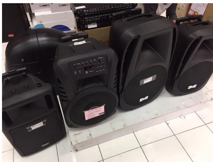
รูปที่ 4.2 ลำโพงล้อยากที่ใช้ในการเดินประชาสัมพันธ์ไปยังจุดต่างๆภายในบริเวณห้าง

4.1.4 ติดต่อสอบถามราคาอุปกรณ์ที่จะต้องใช้ในการจัดงาน ร้านอมร เพื่อดูในเรื่องของ ลำโพงล้อยาก และร้านเก็ท ทีเซ็ด เพื่อสอบถามราคาเสื้อยืดพร้อมสกรีนลายบัตรเครดิต และหาซื้อ อุปกรณ์ต่างๆที่จะต้องใช้ในงานนิวลुकนิวออฟเฟอร์