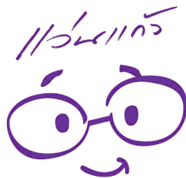
ไตแสงสว่างแก่ดวงตา ไตแสงสว่างแก่ชีวิต

เป็นรูปหน้ายิ้มใส่แว่นซึ่งหมายถึงการมอบแว่นตาให้แก่ผู้ยากไร้ ได้มีแว่นเป็นของตัวเอง การได้แว่นนั้นเหมือนเป็นการให้ชีวิตใหม่แก่พวกเขาให้ได้กลับมามองเห็นได้อย่างชัดเจนอีกครั้ง