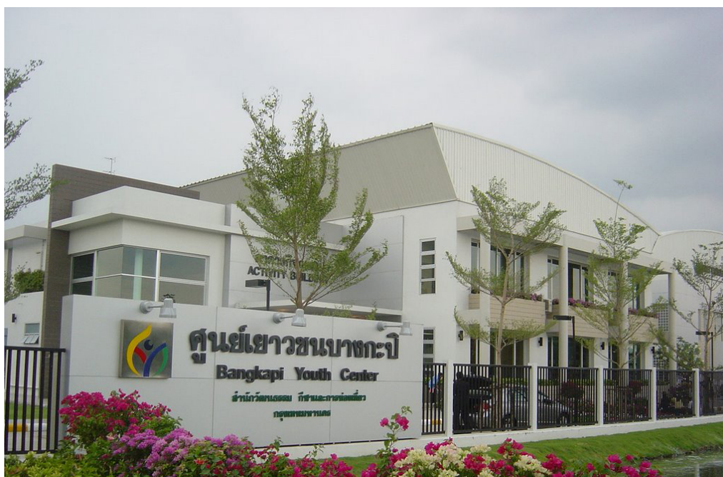
รูปที่ 3.3 ศูนย์เยาวชนบางกะปิ กongsันทนาการ การกีฬาและท่องเที่ยว

เป็นการก่อสร้างด้วยรูปแบบและอาคารที่ทันสมัยบนพื้นที่ 14 ไร่ ประกอบไปด้วยอาคาร 3 หลัง คือ อาคารกิจกรรม, อาคารกีฬาในร่มและอาคารสระว่ายน้ำ ตัวอาคารล้อมรอบด้วยบึงน้ำ ภายในอาคาร 2 ชั้น ประกอบไปด้วย ด้วย ห้องกิจกรรมหลากหลาย สนามแบดมินตัน 4 สนาม, ห้องเทเบิลเทนนิส, ห้องฟิตเนสที่มีเครื่องออกกำลังกายถึง 28 ชุด, สระว่ายน้ำ ขนาด 12.50x25.00 เมตร, ห้องเอนกประสงค์สำหรับกิจกรรมโยคะ ลีลาศ เทควันโด, ห้องสมุดอินเทอร์เน็ตพร้อมอินเทอร์เน็ต 6 เครื่อง โดยจะแบ่งให้เด็กเข้ามาเล่นเกมได้คนละ 1 ชั่วโมงใน 1 วัน, ห้องศิลปะ, ห้องดนตรีสากล, ห้องดนตรีไทย, ห้องนาฏศิลป์, ห้องมินิเธียเตอร์ 40 ที่นั่ง