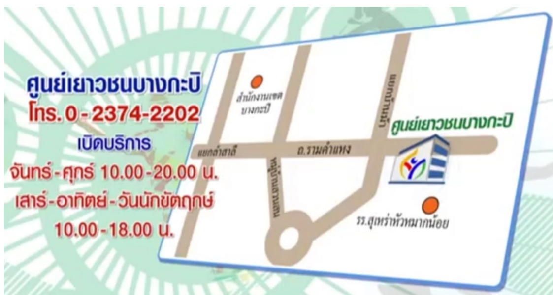
รูปที่ 3.2 แผนที่ของศูนย์เยาวชนบางกะปิ กองนันทนาการ การกีฬาและท่องเที่ยว