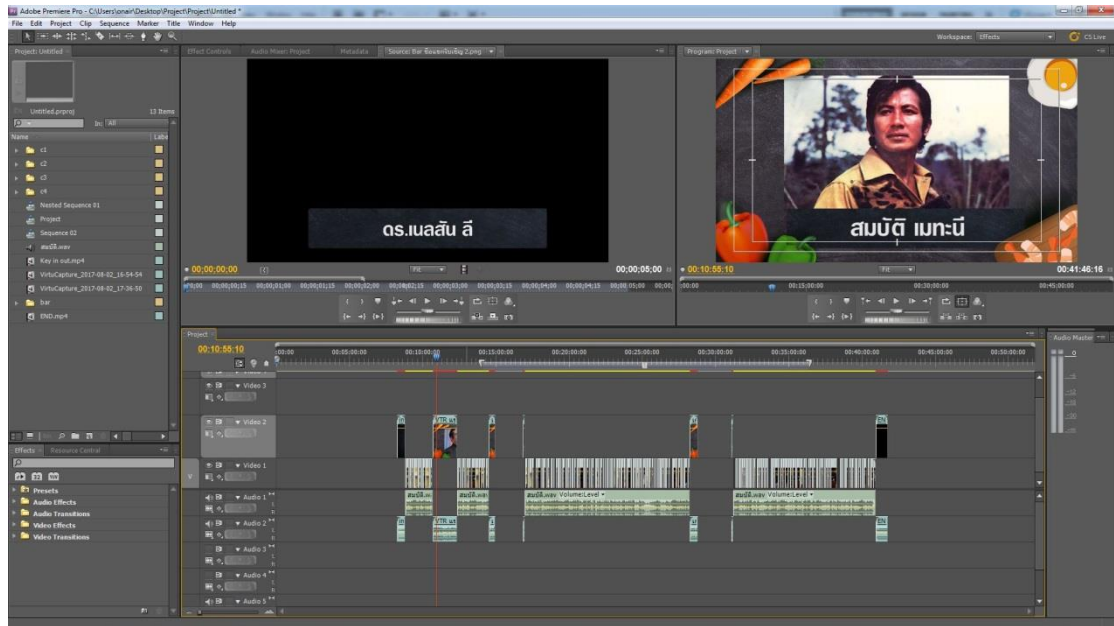
รูปที่ 4.5 ขั้นตอนการใส่ คีย์ซันและVTR