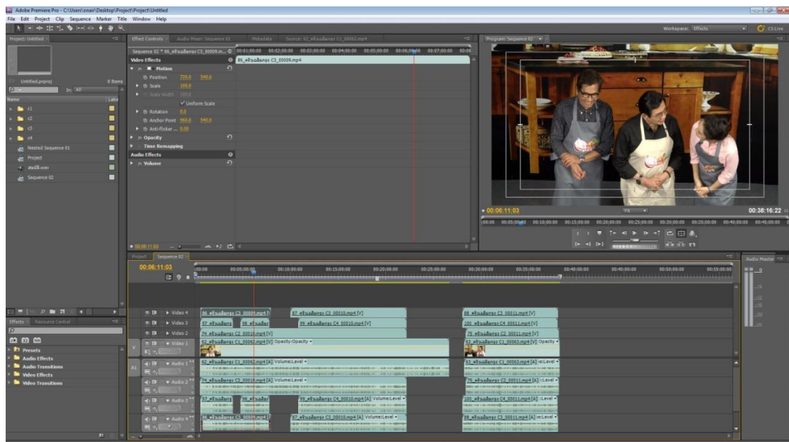
รูปที่ 4.2 ขั้นตอนการแยกเสียง (ก่อนทำ)

เป็นขั้นตอนการเรียบเรียงเนื้อหาทั้งหมด มาประกอบกัน โดยจะแยกโฟลเดอร์ต่างๆ เช่น เสียง ภาพ เพื่อง่ายต่อการนำมาใช้ในขั้นตอนการผลิต การตัดต่อเสียงหรือแยกเสียง เพื่อเตรียมความพร้อมในขั้นตอนการผลิตต่อไป