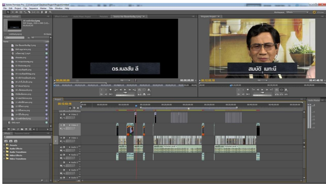
รูปที่ 4.6 ขั้นตอนการใส่บาร์ชื่อพิธีกร-แขกรับเชิญและวัตถุคิบบต่างๆ