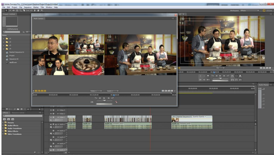
รูปที่ 4.4 ขั้นตอนการ Switching ทั้ง 4 กล้อง (Multi Camera)

ตัวส่วนประกอบทุกส่วนที่จัดเตรียมไว้ มาประกอบด้วยกัน ด้วยโปรแกรม Adobe Premier Pro โดยการใช้ Multi Camera ทั้งหมด 4 กล้อง และทำการ Switching ในแต่ละช็อต ได้ VTR, คีย์ซีน เข้า-ออก และบาร์ช็อตต่างๆ