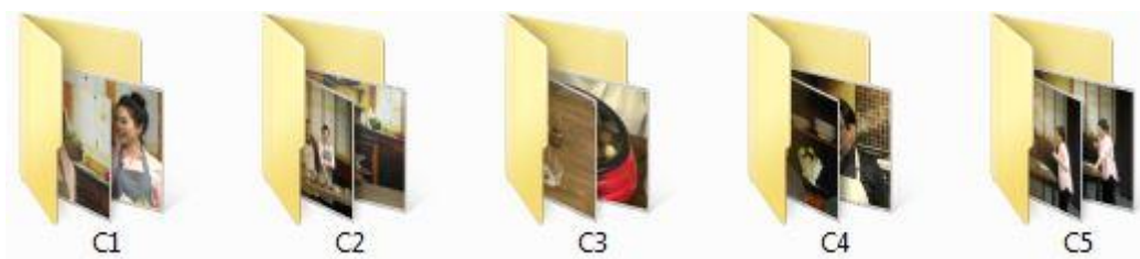
รูปที่ 4.1 คัดแยกไฟล์กล้อง

รวบรวมไฟล์กล้องที่ใช้ถ่ายทำรายการทั้งหมด 5 กล้อง ข้อมูลอื่นๆ และจัดให้เป็นระเบียบเพื่อสามารถนำมาใช้ได้ง่าย