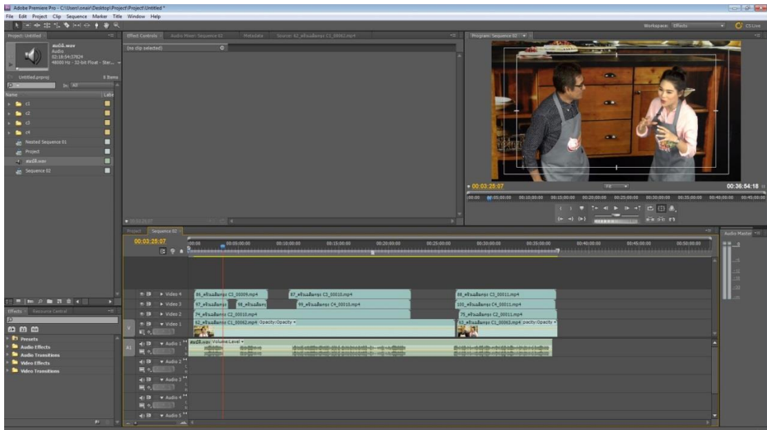
รูปที่ 4.3 ขั้นตอนการแยกเสียง (หลังทำ)