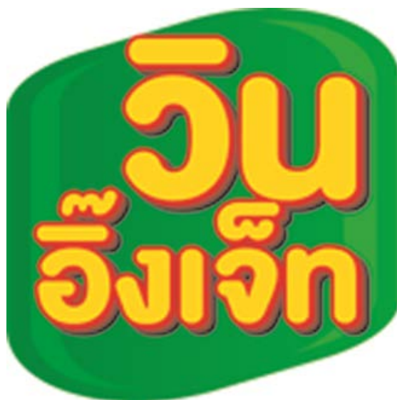
รูปที่ 3.1.3 ตราสัญลักษณ์ (Logo) บริษัท วิน อิงเจ็ด จำกัด