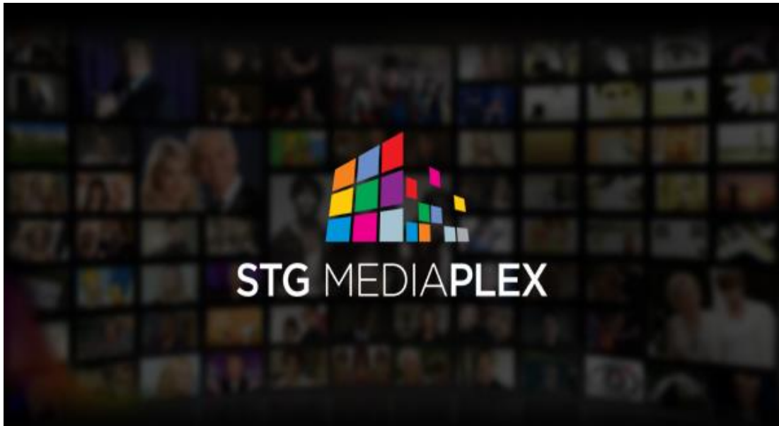
ภาพที่ 3.1 ตราสัญลักษณ์บริษัท เอสทีจี มีเดียเพล็กซ์ จำกัด