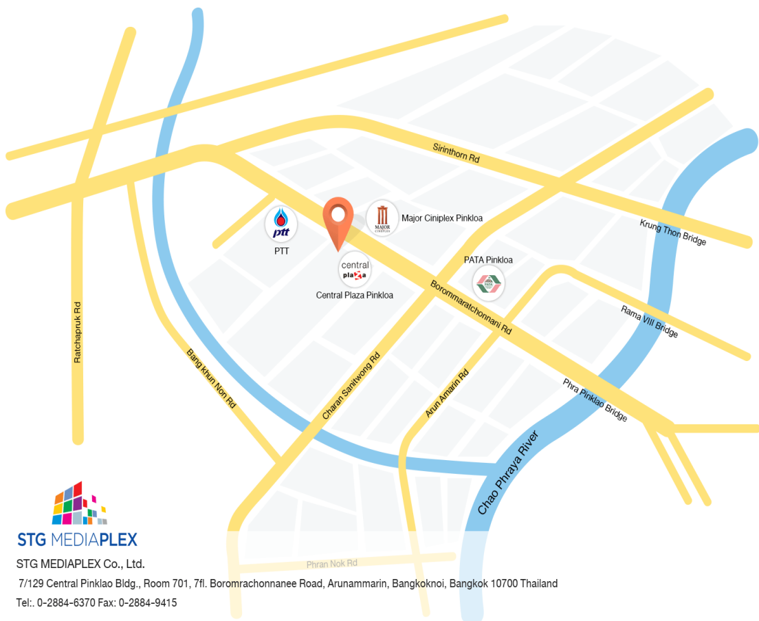
ภาพที่ 3.2 สถานที่ตั้งของสถานประกอบการ