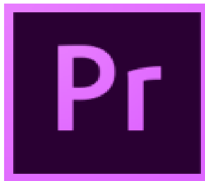
ภาพที่ 3.4 โปรแกรม Adobe Premiere Pro