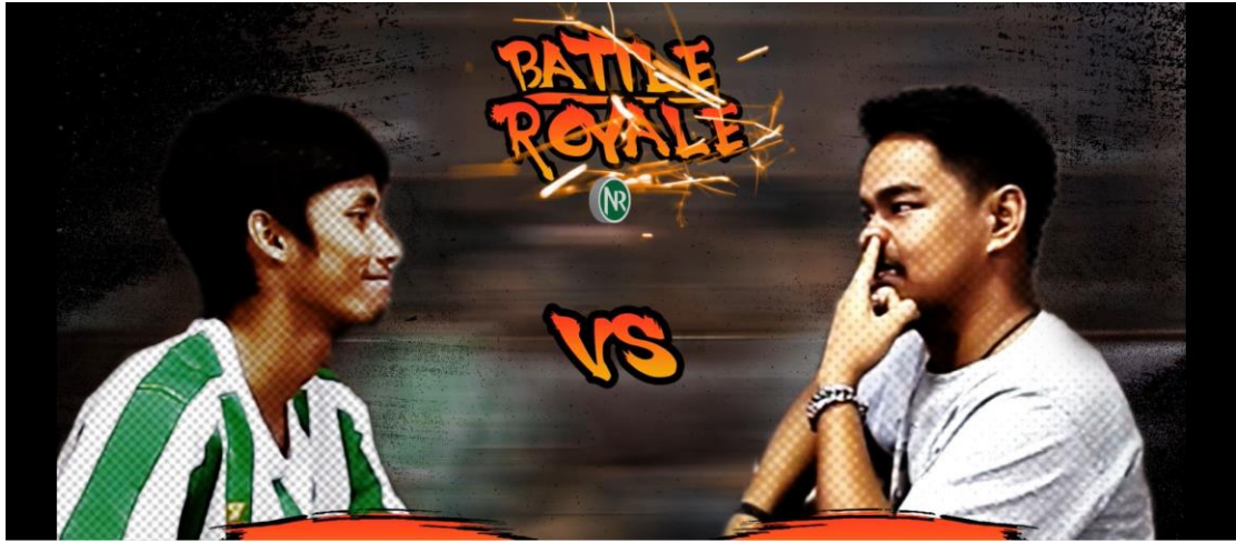
ตัวอย่างรายการที่ทำกราฟิกเสร็จสมบูรณ์