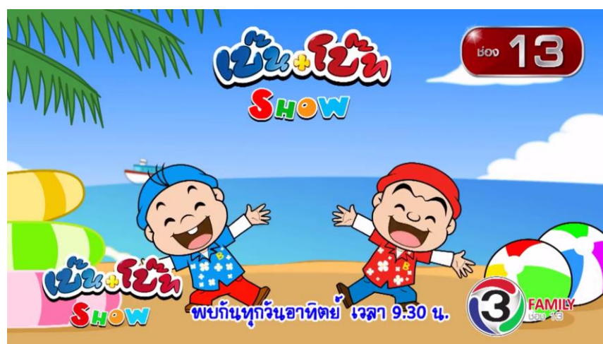
รูปที่ 3.4 ภาพรายการการ์ตูนเป็นโป๊ท ไซร์ช่อง 13 Family