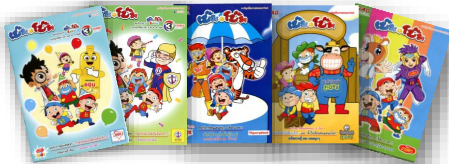
รูปที่ 3.3 หนังสือการ์ตูนเป็นโป๊ท