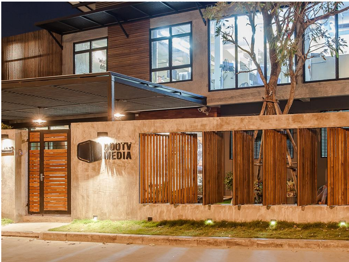
รูปภาพ 3.3 หน้า บริษัท ดูทีวี มีเดีย จำกัด