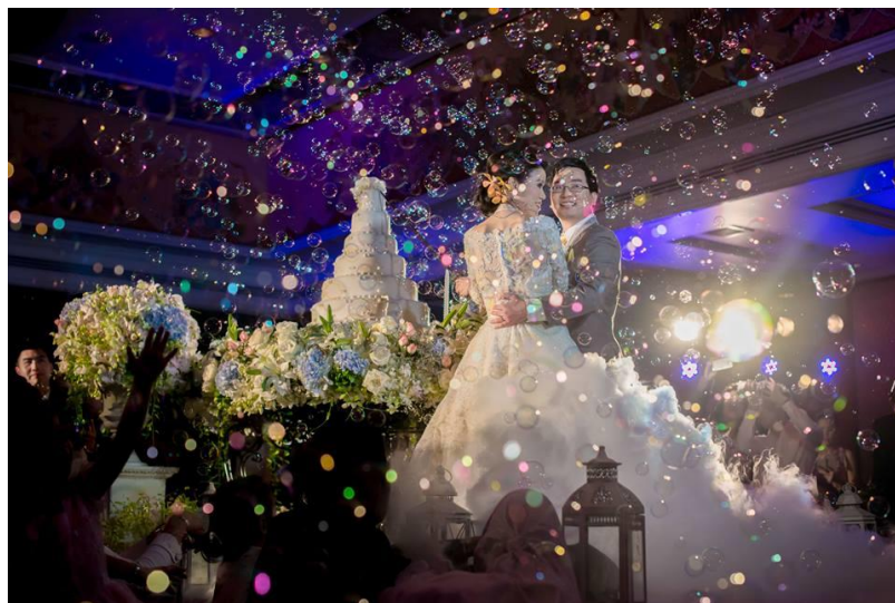
รูปที่ 3.3 ตัวอย่างผลงานการถ่ายภาพงานแต่งงานของบางรักสตูดิโอ

บางรักสตูดิโอเป็นองค์กรเอกชนมีลักษณะการให้บริการด้านการผลิตสื่อให้กับลูกค้าทั้งภาพนิ่ง และ วีดีโอในงานพิธีต่างๆ เช่น งานแต่ง งานบวช งานรับปริญญา งานมงคลต่างๆ ลักษณะหน้าที่ที่องค์กรมอบหมายให้นักศึกษาฝึกงาน คือฝึกการเป็นช่างภาพ ช่างแต่งภาพ ช่างตัดต่อวีดีโอ การจัดไฟทั้งในสตูดิโอและนอกสถานที่