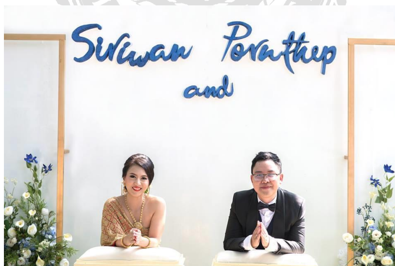
รูปที่ 3.4 ตัวอย่างผลงานการถ่ายภาพงานแต่งงานของบางรักสตูดิโอ