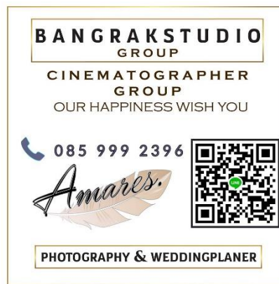
รูปที่ 3.1 รูปแบบนามบัตรสถานประกอบการ