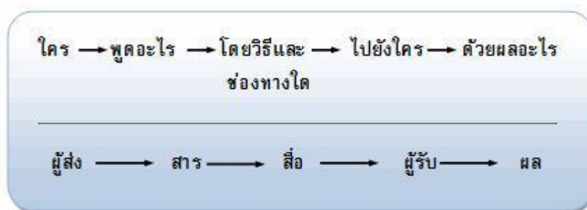
ภาพที่ 2.1 ภาพเปรียบเทียบสูตรการสื่อสารของลาสเวลล์กับองค์ประกอบของการสื่อสาร

2.1.5 ได้ผลอย่างไรในปัจจุบัน และอนาคต คือ การส่งข่าวสารนั้นเพื่อให้ผู้รับฟังผ่านไปเฉย ๆ หรือจดจำด้วยซึ่งต้องอาศัยเทคนิควิธีการที่แตกต่างกัน และเช่นเดียวกันกับการเรียนการสอนที่จะได้ผลนั้น ผู้สอนจะต้องตระหนักอยู่เสมอว่าเมื่อสอนแล้วผู้เรียนจะได้รับความรู้มากน้อยเท่าใด