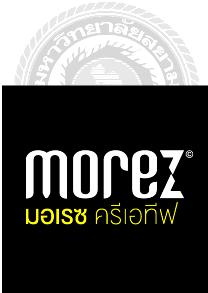
รูปที่ 3.1 ตราสัญลักษณ์ (logo) บริษัท Morez Creative

3.2.1 ที่ตั้งสถานประกอบการ : 1 ถนนพุทธมณฑลสาย 2 แขวงบางแคเหนือ เขตบางแค กรุงเทพมหานคร 10160 โทรศัพท์: 02-454-1433