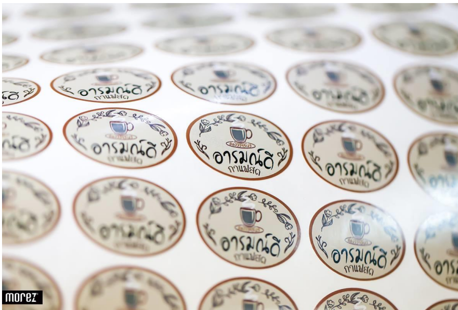
รูปที่ 3.3 ตัวอย่างงานสติ๊กเกอร์ของ Morez Creative