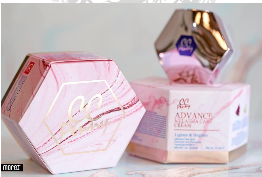
รูปที่ 3.4 ตัวอย่างงานบรรจุภัณฑ์ของ Morez Creative