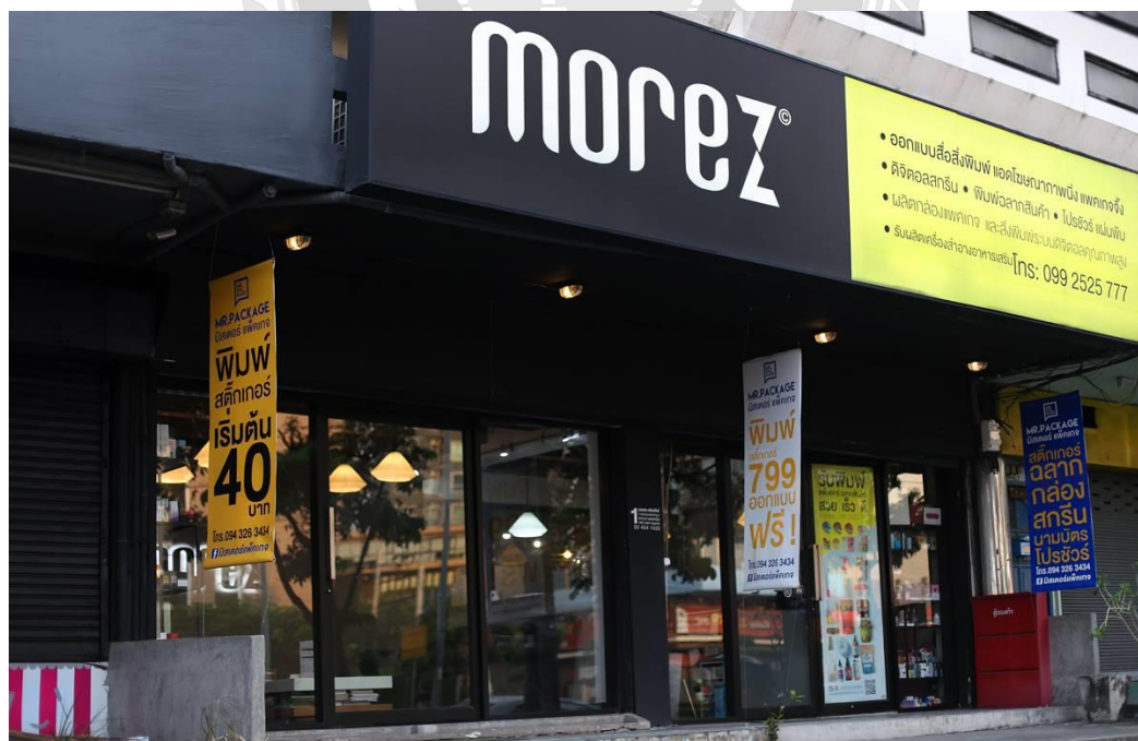
รูปที่ 3.2 บริษัทที่ปฏิบัติงานสหกิจศึกษา Morez Creative