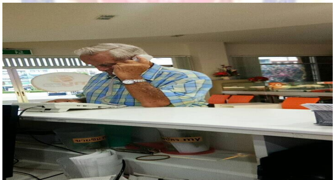
รูปที่ 4.6.2 ภาพขณะปฏิบัติงาน