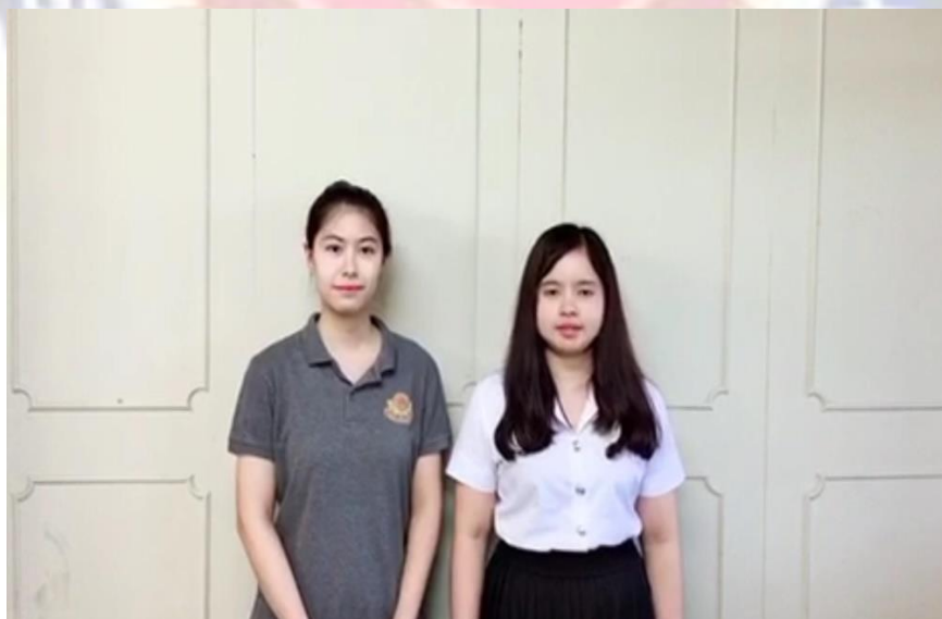
รูปที่ 4.8.1 ภาพขณะทำวิดีโอ