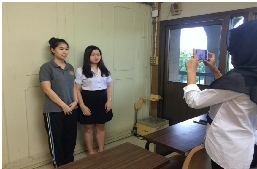
รูปที่ 4.7.1 ภาพเบื้องหลังการถ่ายทำ