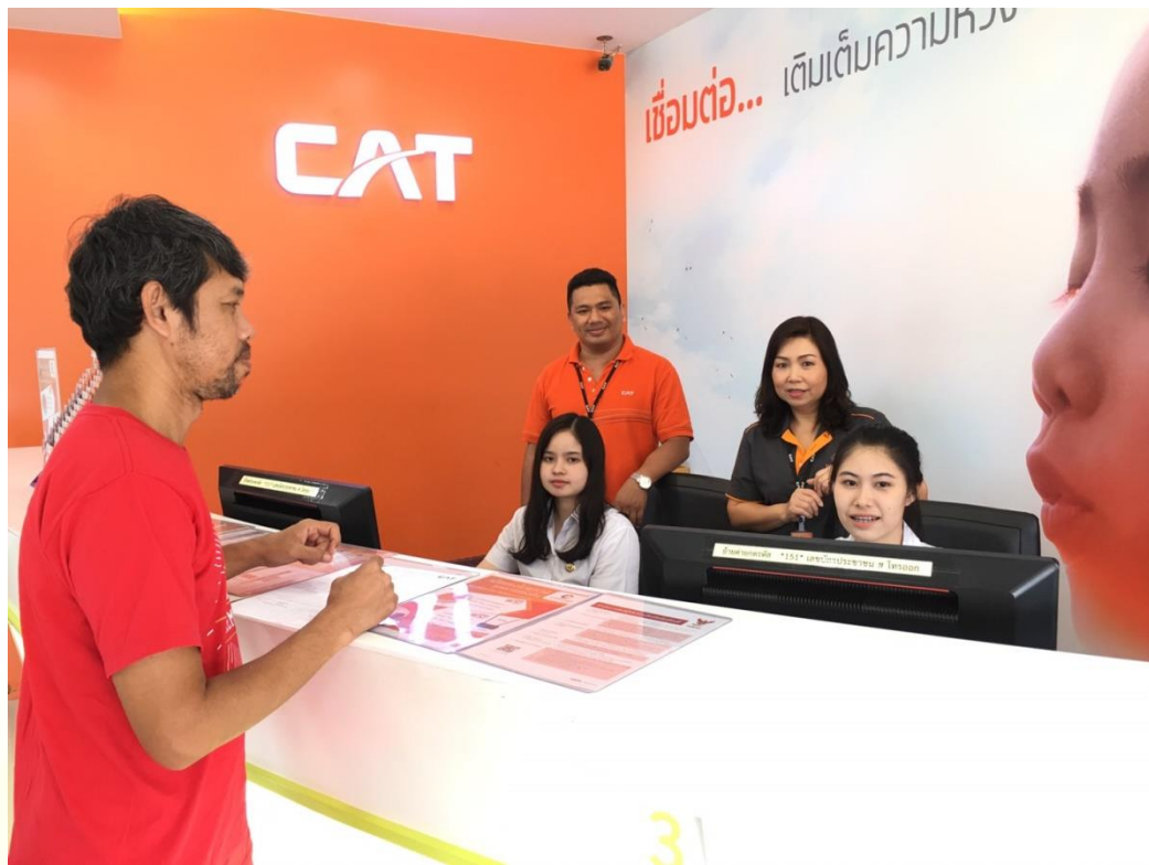
รูปที่ 4.6.1 ภาพขณะปฏิบัติงาน