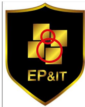
รูปที่ 3.1 ตราสัญลักษณ์ (LOGO) บริษัท อีพี แอนด์ ไอที โซลูชัน จำกัด