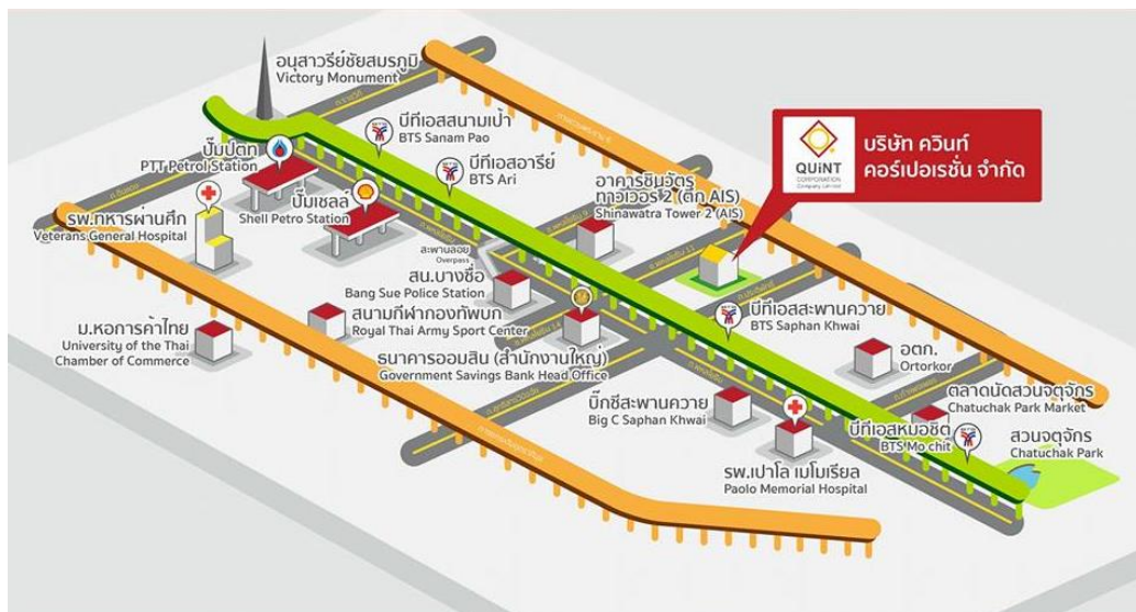
รูปที่ 3.1 แผนที่บริษัท ควินท์ คอร์ปอเรชั่น จำกัด