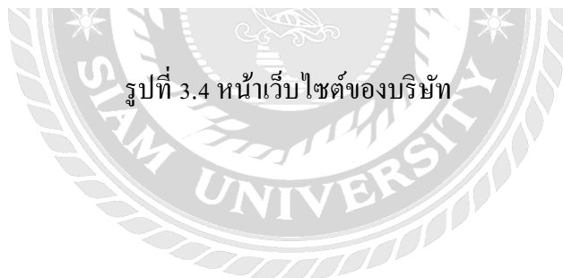
รูปที่ 3.4 หน้าเว็บไซต์ของบริษัท