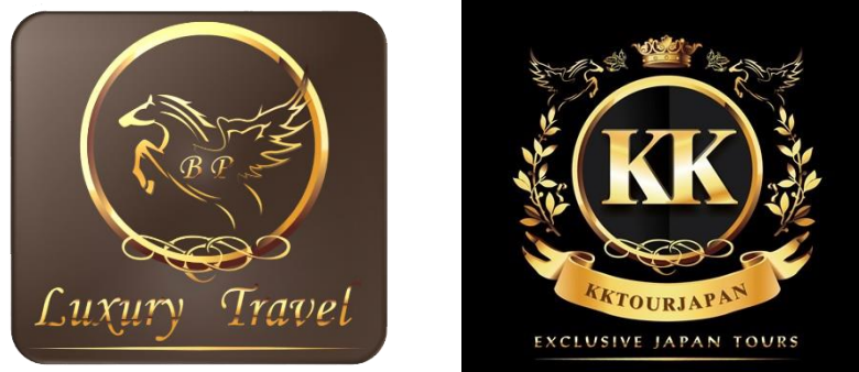
รูปที่ 3.1 โลโก้สัญลักษณ์ของบริษัท บีพี ลักซ์ชูรี ทราเวล จำกัด