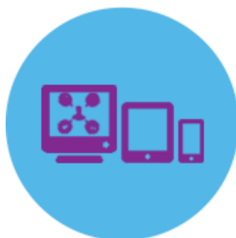
รูปภาพที่ 3.7 บริการดิจิทัล

เรามั่นใจว่าการดึงสิ่งที่อยู่ในใจกลุ่มเป้าหมาย มาเป็นกลยุทธ์เชิงสร้างสรรค์เท่านั้น ที่จะช่วยสร้างงานครีเอทีฟให้แข็งแรงและประสบผลสำเร็จได้ เราจึงพยายามค้นหาและทำความเข้าใจชีวิตความเป็นอยู่ของพวกเขา เพื่อให้รู้ว่าเขาต้องการอะไรและต้องการเมื่อไหร่