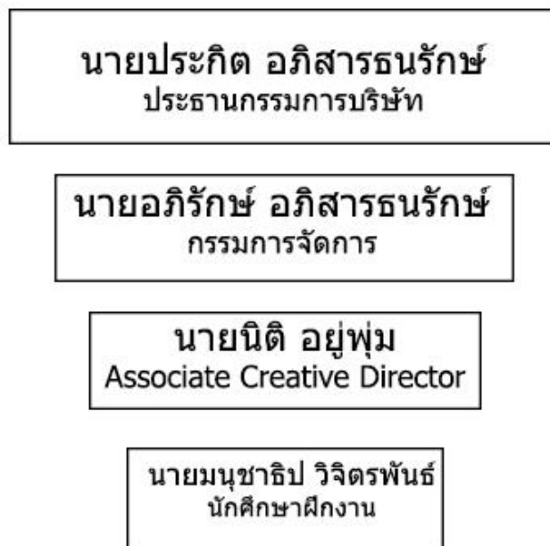
รูปภาพที่ 3.9 แผนภูมิการจัดองค์กร และการบริหารงานบริษัท ประกิต แอดเวอร์ไทซิ่ง จำกัด