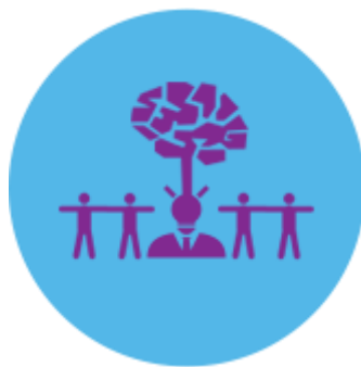
รูปภาพที่ 3.5 บริการความคิดสร้างสรรค์