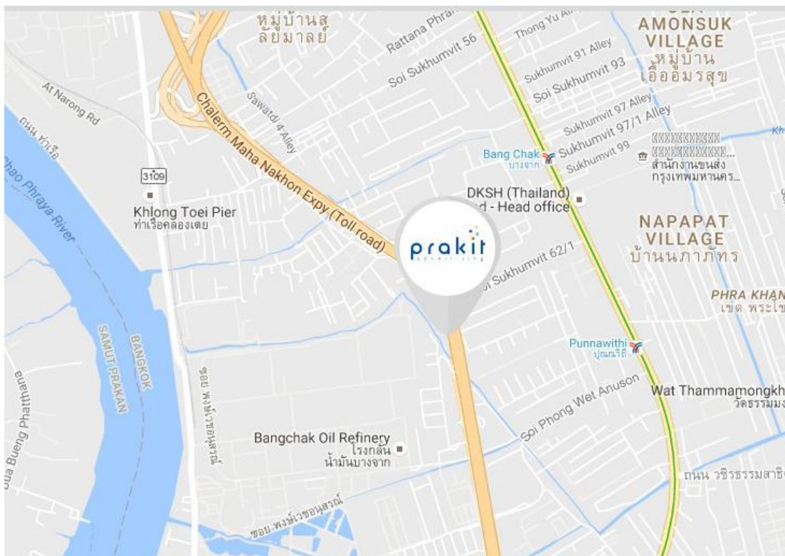
รูปภาพที่ 3.2 แผนที่รูปภาพที่ บริษัท ประกิต แอดเวอร์ตีซิง จำกัด